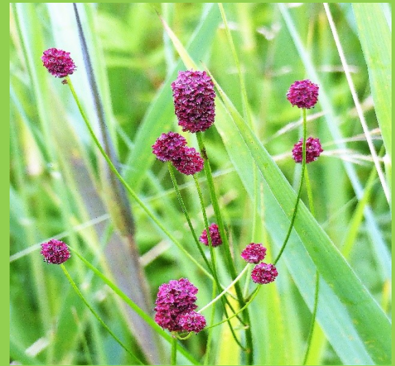
Rode Pimpernel, de 'waard' van Pimpernel-blauwtje

Een heel ander voorbeeld is dat van het Pimpernelblauwtje. Een mooi en zeldzaam vlindertje dat afhankelijk is van zijn waardplant de Grote Pimpernel. Die zoals een gastheer - 'de waard' - betaamt, goed zorgt voor zijn bezoekers. Op die Grote Pimpernel legt mama Pimpernelblauwtje haar eitjes. De rupsjes eten van de bloemknoppen, laten zich dan op de grond vallen. En blijken te kunnen 'roffelen' om met geluk zo een toevallige 'moerassteekmier' te lokken. Die het rupsje meeneemt naar zijn mierennest. Want ze scheiden honing af waar de mieren wel soep van lusten! In het nest groeit het rupsje goed, want ze eet volop mierenlarfjes op! Na een jaar verpopt het rupsje zich, komt daarna als vlinder tevoorschijn en moet zorgen dat ze wekomt, de mieren hebben het bedrog in de gaten! Het Pimpernelblauwtje leeft dan nog twee dagen om te paren en eitjes af te zetten. Uiteraard op de Grote Pimpernel, haar waard! Een wondertje dat er op die manier toch weer Pimpernelblauwtjes voortleven, ook in Nederland. Eerder uitgestorven, maar dankzij herintroductie weer actief in enkele van onze natte heidevelden.