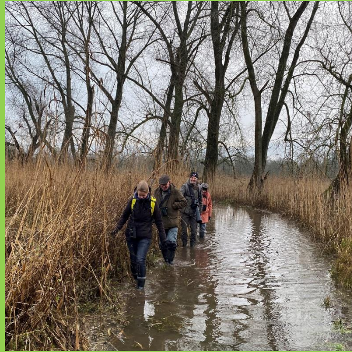
Hoogwater in Biesbosch, vogelaars op laarzenpad.

Maar het moet wel gezellig blijven. Als paarden en koeien in een iets strengere winter hongerlijden doordat er te weinig voedsel is en de populatie te groot, dan zullen hordes paardenmeisjes (m/v/a) hooibalen over de hekken van onze natuurgebieden gooien om te zorgen dat die lieve dieren nou ook weer niet té natuurlijk aan hun eind komen. En wat helemaal ontoelaatbaar is: een ander groot dier dat de taak op zich neemt om de grazers eens flink uit te dunnen. Het is niet heel lastig te raden dat ik het hier over de wolf heb: onze favoriete slechterik. Van een hek om Friesland tot een afschotvergunning voor ‘probleemwolven’, het was ongelooflijk hoe snel de maatregelen werden voorgesteld om de controle terug te krijgen over de ‘natuur’.