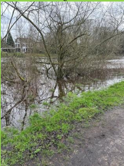
Mark stijgt; laarzenpad nog droog.