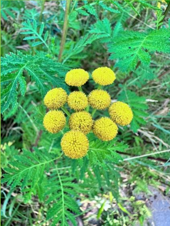
Boerenwormkruid als speldenkussentjes zo groot.

Het is en was voor mij een bijzondere zomer 2024. In Markdal en Wouwerbeek was dat heel duidelijk zichtbaar. Alles was anders dan anders, alles bleef grasgroen en er was veel water! Maar ook massale extra groei van verschillende planten en vruchten door het vele regenwater en warmte in de grond, was wat me erg verbaasde. Dit jaar hebben we onze tuinen en landbouwgronden niet hoeven te besproeien er was zeer regelmatig erg veel regenwater, plassen en sloten traden vaak buiten hun oevers. Daardoor groeide langs de