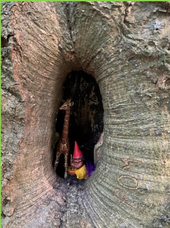
Beukbewoners Kabouter en Giraf.