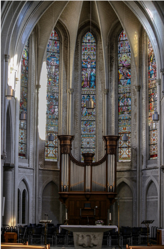
Het fameuse Penthegem orgel