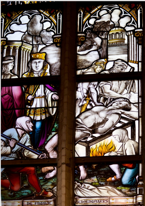
De verbranding van de Heilige Laurentius

Een schitterende kerk, met heel veel licht wat door de glas in lood ramen naar binnen komt. Het werkt heel rustgevend op mij. Ik kom graag in de kerk. Het straalt sfeer uit. Daarnaast het bijna elk hoekje wel wat te vertellen over het verleden.